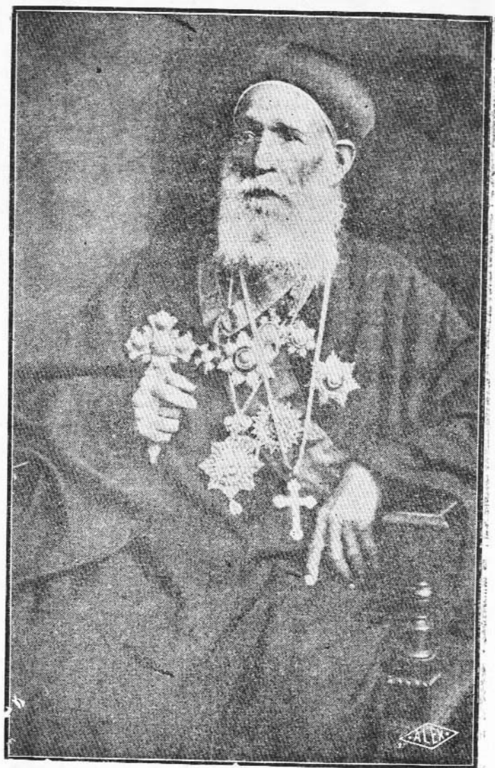
غبطة البابا المعظم الانبا يؤانس التاسع عشر بطريرك الكرازة المرقسية