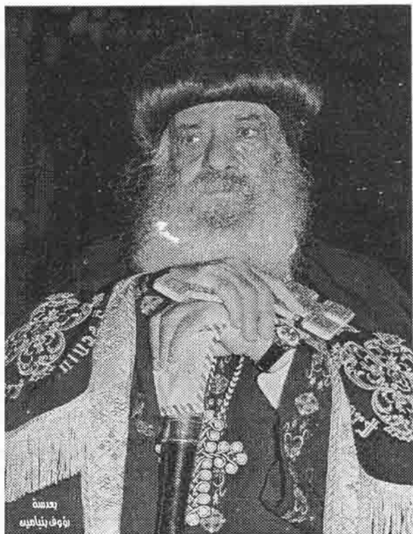
قداسة البابا المعظم الأنبا شنودة الثالث بابا الإسكندرية وبطريك الكرازة المرقسية